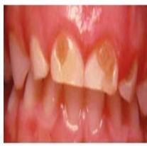
Meno kuoza kiasi