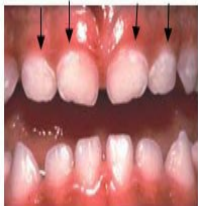
Meno kuanza kuoza