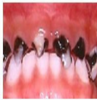
Meno kuoza kabisa